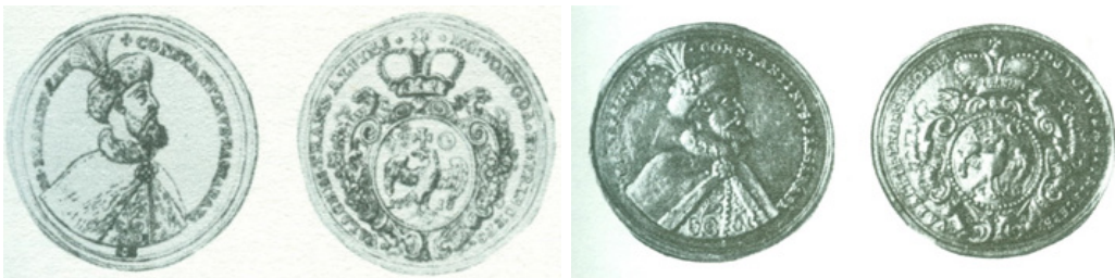
Fig. 6 Monedele din aur cu imaginea lui C. Brâncoveanu

După trei săptămâni, rădvanul cu familia Brâncoveanu intra în Constantinopol. Domnitorul a fost închis imediat la Ediculé, în timp ce ceilalți membri ai familiei fură întemnițați la Ceauș-Emini și Bașbaciculi. Cei închiși fură supuși la multe cazne.