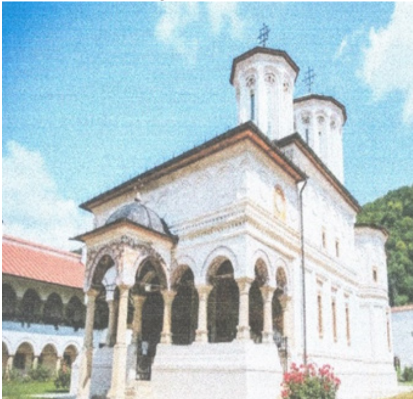
Fig. 5 Mănăstirea Hurezi