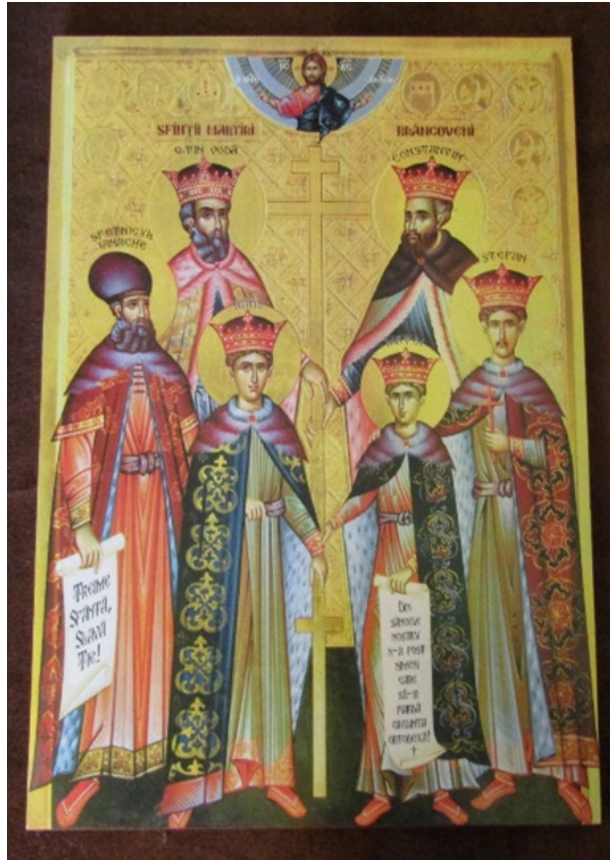
Fig. 7 Icoana cu Sfinții Brâncoveni

Trupurile lor au fost plimbate pe străzile orașului, iar capetele ținute trei zile de poarta cea mare a Seraiului. Seara, leșurile lor au fost aruncate în apele Bosforului. Pescuite de niște greci, din apele mării, cadavrele au fost îngropate în cripta vechii mănăstiri din insula Halki.