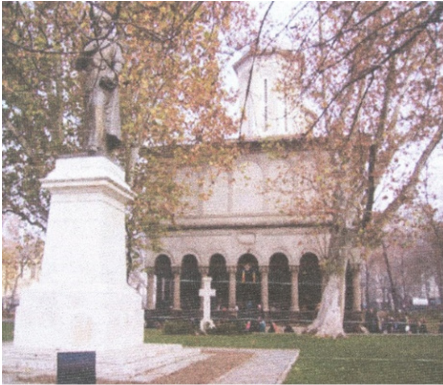
Fig. 3 Biserica Sf. Gheorghe Nou din București, cu statuia lui C. Brâncoveanu

Nou din București, dar și la Făgăraș și Ocna Sibiului. Peste hotare a ctitorit biserici la Ismail, Galata, Arbănași în Bulgaria și San Stefano în Turcia etc. Bolțile palatului de la Mogoșoaia erau decorate cu picturi istorice: vizita lui C. Brâncoveanu la Constantinopol și portretele familiei.