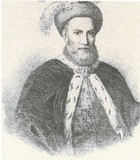
Fig. 2 Constantin Brâncoveanu

Recunoaşterea lui Brâncoveanu de către Poartă ca domn al Ţării Româneşti nu convenea planurilor diplomaţiei franceze, care urmărea să unească eforturile militare ale Transilvaniei şi Ţării Româneşti împotriva Imperiului habsburgic.