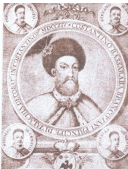
Fig. 4 Medalion cu C. Brâncoveanu și cei 4 fii

conflictul dintre înrudirile familiei. În anul 1703, Brâncoveanu, ca urmare a uneltirilor lui Alexandru Mavrocordat, este chemat la Constantinopol pentru a săruta poala împărătească. O asemenea invitație era foarte primejdioasă, putându-se termina chiar cu pierderea vieții. Brâncoveanu pleacă la Istanbul în fruntea unei impresionante delegații și este primit cu mari onoruri de către sultan și marele vizir. Pentru a se bucura de această primire, a trebuit mai întâi să facă o adevărată risipă de aur și cadouri. Sultanului i-a dat 200 de pungi cu aur, sultanei Validé i-a făcut multe cadouri, dar a dat și multe pungi cu aur marelui vizir, marelui muftiu și altor dregători turci.