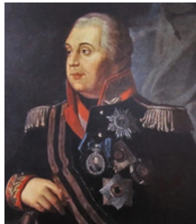
Generalul Mihail Kutuzov, negociatorul rus care a încheiat pacea cu otomanii pe 28 mai 1812

Armand Goșu explică implicațiile acestui act și arată că niciuna din tabere nu are de ce să fie mulțumită: „Atingerea liniei fluviului (Dunărea – n. red.), chiar și pe o porțiune mica, a reprezentat indiscutabil un succes al politicii de expansiune a Rusiei în direcția Istanbulului (Constantinopole – n. red.). Anexarea teritoriului dintre Prut și Nistru oferea imperiului pravoslavnic un culoar strategic, de unde se putea pătrunde ușor spre inima Peninsulei Balcanice. În același timp, Rusia cuprindea între granițele sale prima și singura populație de origine latină și limba romanica din regiune. În același timp însă, din vastul plan de