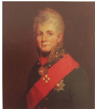
Amiralul Pavel Ciciagov, ultimul guvernator al țărilor române ocupate de ruși în 1812, înainte ca aceștia să se retragă total, în iulie același an.

Una peste alta, deciziile lui Kutuzov sunt corecte și Alexandru I înțelege asta, pentru că altfel n-ar fi fost semnată nicio pace cu turcii. Generalul chiar îi scrie acest lucru țarului.