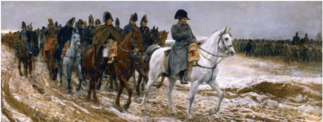
Invazia lui Napoleon în Rusia, începută la 24 iunie 1812, a salvat țările române. Fără atacul francezilor, rușii ar fi anexat complet cele două principate, transformându-le în gubernii, exact cum au făcut cu Basarabia.

Acesta este elementul-cheie în povestea tratatului ruso-otoman, care va influența decisiv soarta românilor, până în zilele noastre. Turcii știu și ei, la fel de bine ca și rușii că urmează atacul francez și că emisarii țarului, deși sunt într-o situație militară favorabilă pe Dunăre, sunt disperăți și vor să încheie cât mai repede pacea aici, ca să poată redirecționa toate trupele disponibile către principalul pericol – așteptata invazie a lui Napoleon.