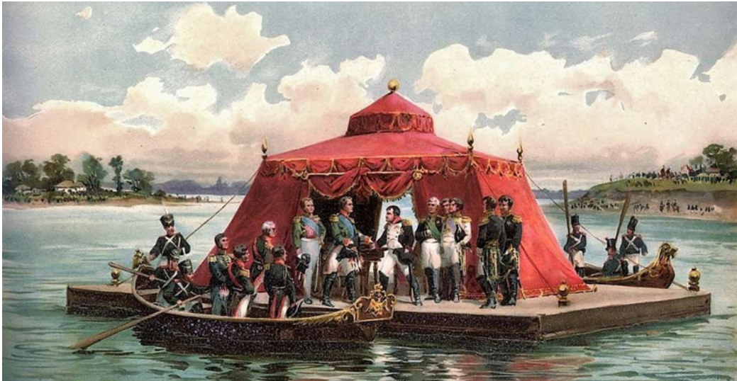
Fig. 2 Întâlnirea de la Tilsit din 7-9 iulie 1807, dintre Napoleon (dreapta) și Alexandru I (stânga), la care francezul i-a oferit rusului Principatele Române

cotropirea și rusificarea totală. Azi, înțelegem acest lucru datorită muncii de cercetare pe care a făcut-o istoricul Armand Goșu chiar în arhivele de la Moscova și de la Istanbul, efortul său concretizându-se într-o carte esențială pentru înțelegerea originii problemei basarabene cu titlul : "Între Napoleon și Alexandru I".