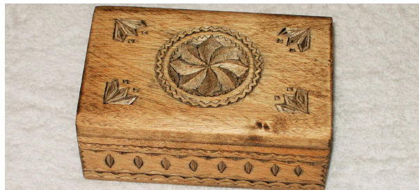
Fig. 5 Cutia cu simbolul solar

Dar simbolul solar, meșterul popular l-a reprezentat și pe o cutiuță frumos ornată.