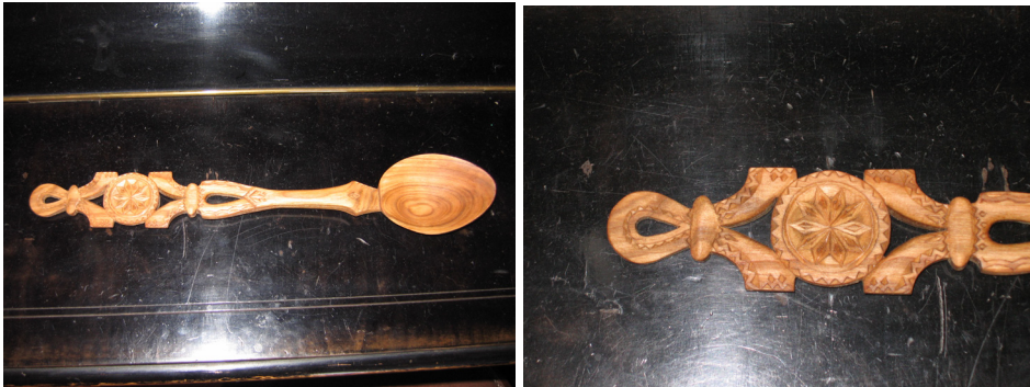
Fig. 1 Simbolul solar pe lingură

Simbolul solar – Reprezintă divinitatea și se pune pe obiecte cu scopul de a proteja pe cel ce folosea obiectul respectiv