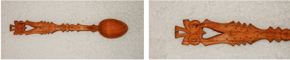
Fig. 2 Bufnița ca simbol pe lingură

Bufnița – Este considerată simbolul înțelepciunii deoarece, din punct de vedere spiritual, ea vede acolo unde ceilalți nu văd, adică în întunericul ignoranței.