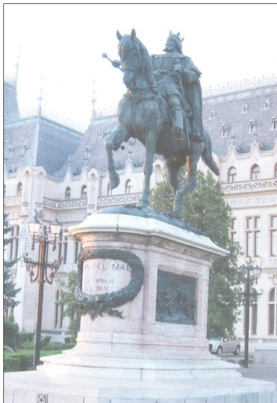
Fig. 1 Statuia lui Ștefan cel Mare din Iași

În ședința Academiei din 24 ianuarie 1882, când statuia era deja terminată, pictorul Epaminonda Bucevschi, a prezentat copii făcute de el după toate tablourile votive din bisericile lui Ștefan cel Mare din Bucovina. Acum s-a putut constata că în tablourile votive, Ștefan cel Mare era pictat fără barbă.