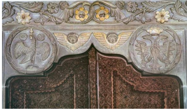
Fig. 2 Portalul bisericii Hurezi, cu stema brâncovenească și cantacuzină

Cel care, într-un timp al nesiguranței, își cerceta viitorul pe căile oculte ale astrologiei, consultând horoscoape dar care, într-un timp baroc, privea cu orgoliu către trecutul bizantin spre care coborau rădăcinile neamului său matern; de unde venea stema cu acvila bicefală cioplită în piatră, ce face trecerea din pridvor în pronaosul bisericii mari a Mănăstirii Hurezi; de unde apărea galeria de portrete cantacuzinești.