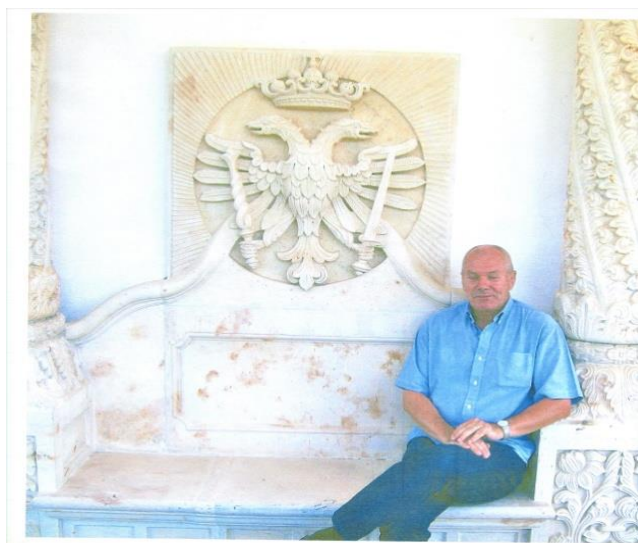
Fig. 4 Stema cantacuzină de la Mănăstirea Sâmbăta de Sus

Sfârșitul lui Constantin Brâncoveanu a fost voit de călăii săi, nu departe de chioșcul sultanului Ahmed al III-lea, aidoma unui spectacol care venea să înfricoșeze. Se încheia astfel o viață de erou parcă desprins dintr-o dramă barocă așa cum se scriau atâtea în perioada lui 6 .