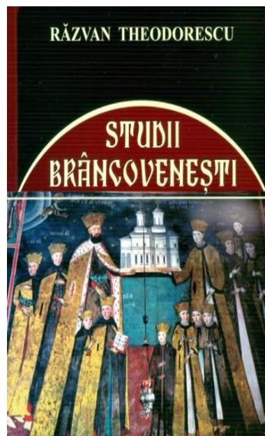
Fig. 1 Studii Brâncovenești de acad. Răzvan Theodorescu

Interesant este și faptul că acest studiu este ilustrat cu 27 de imagini legate de bisericile domnești.