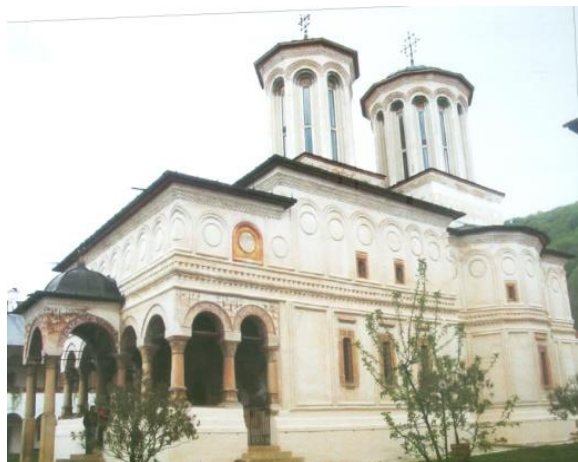
Fig. 3 Biserica Hurezi

Încercarea lui Constantin Brâncoveanu de a instaura, cu ambiții pe măsură, o stabilitate politică demult neatinsă, într-o domnie de mai mult de un sfert de veac, rămâne în istoria noastră un gest eroic.