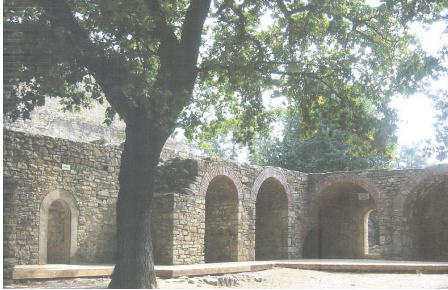
Fig. 2 Curtea interioară a Cetății

Urmașii lui Ștefan cel Mare, Bogdan al III-lea (1504-1517) și Ștefăniță Vodă (1517-1527) au efectuat lucrări de mică amploare la refacerea cetății.