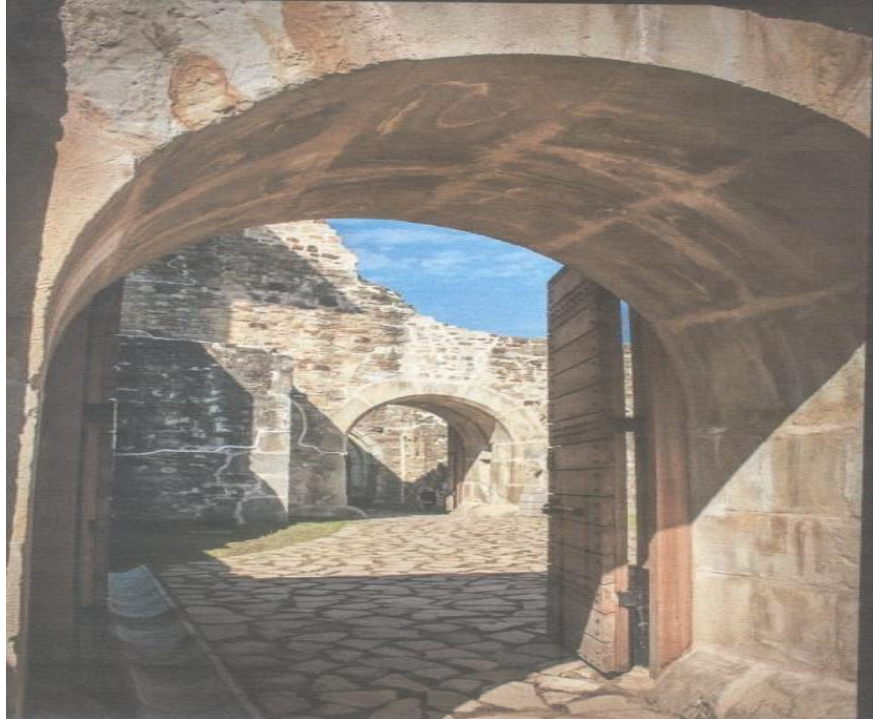
Fig. 3 Holul de acces

Domnitorul Eustatie Dabija (1661-1665) dispune instalarea în Cetatea Sucevei a unei monetării, care funcționează în perioada anilor 1662-1668, unde au fost emise ultimele monede moldovenești din aramă, numite „șalăi”.