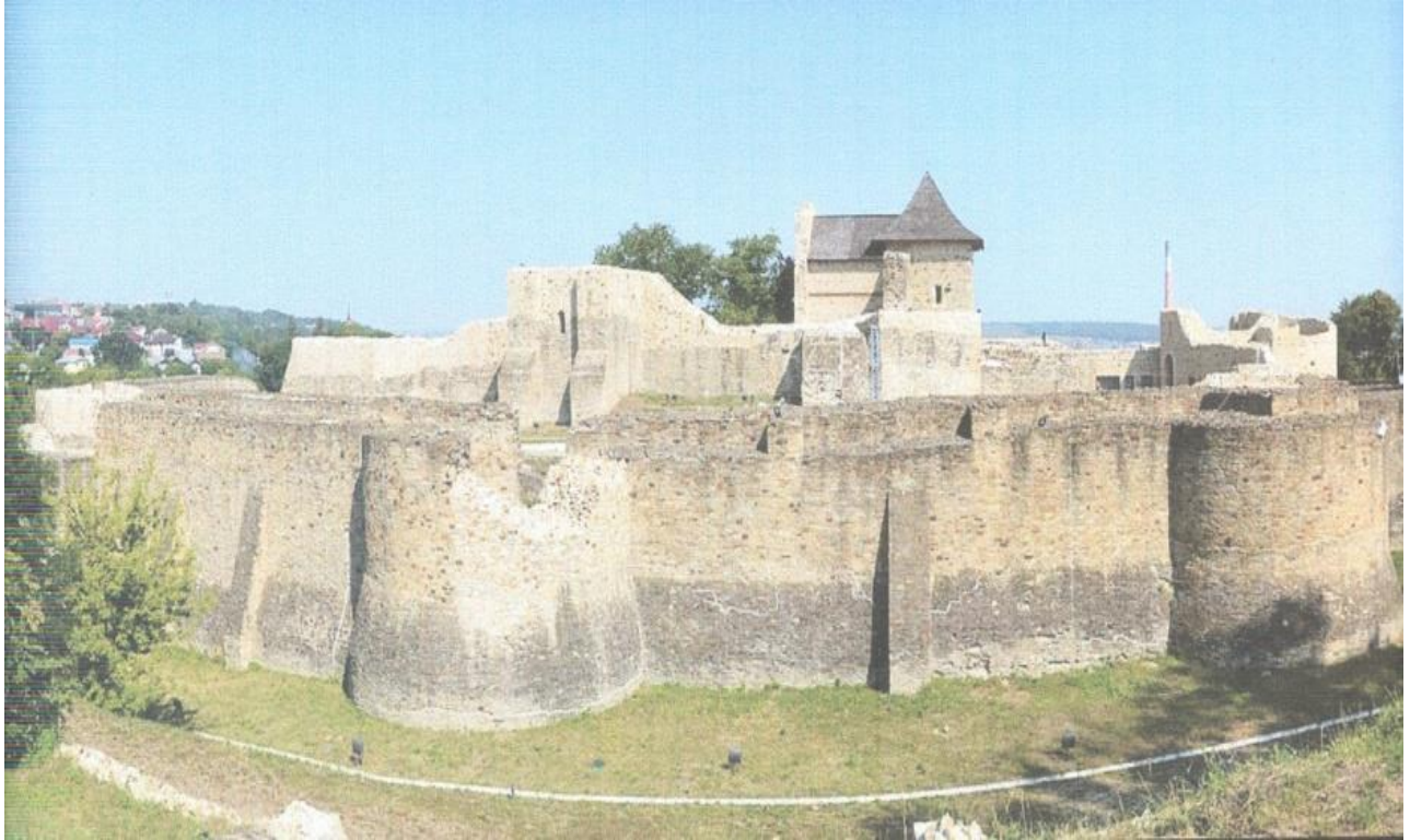
Fig. 1 Cetatea de Scaun a Sucevei

Pentru a proteja intrarea în cetate de mijloacele de artilerie, domnitorul Alexandru cel Bun (1400-1432) a construit un zid paralel cu zidul cetății și a pavat curtea interioară și căile de acces spre cetate 3 .