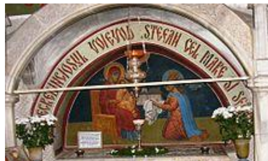
Mormântul lui Ștefan cel Mare și al soției sale Maria Voichița din groznița bisericii mănăstirii Putna