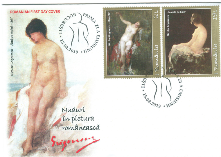
Fig. 2 Plicul „prima zi” cu tabloul Bacanta și Înainte de baie

La Școala de Arte din Paris, pentru care primise bursa, trebui să intre prin concurs, pe care îl trece înaintea lui Renoir, care concurase și el. Descoperă valoarea grupului de la Barbizon, unde va merge în vara anului 1862, împreună cu Rousseau, Courbet, Millet, Corot, Diaz, Monet și Renoir 5 .