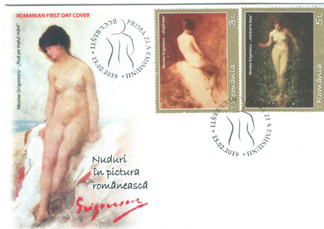
Fig. 3 Plicul „prima zi” cu lucrarea După baie și Intrând în baie

Timbrul care reproduce lucrarea După baie are valoarea de 3 lei , în care personajul este văzut din spate, manieră picturală ce pune mai bine în valoare linia delicată a formelor.