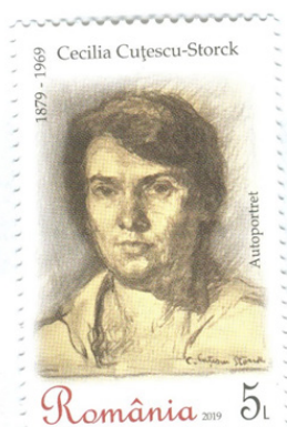
Fig. 1 Timbrul cu autoportretul Ceciliei Cuțescu - Storck

Când a împlinit vârsta de 16 ani, a rugat părinții să o retragă de la această școală, pentru că nu dorea să urmeze o carieră pedagogică.