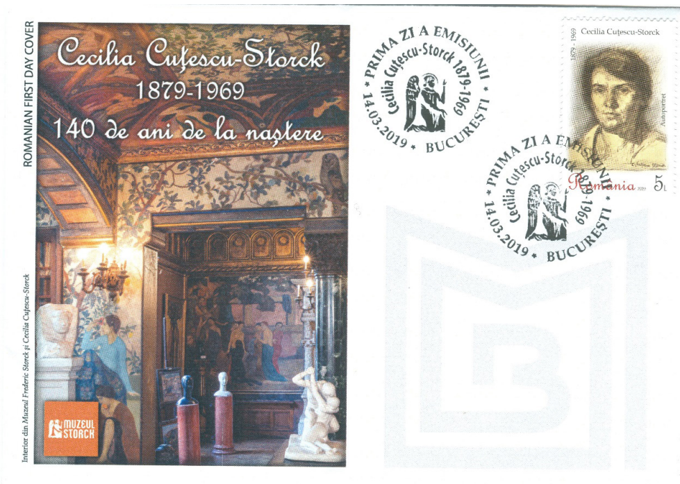
Fig. 3 Plicul prima zi cu Muzeul Storck

În ultimii ani din viață, Cecilia s-a ocupat de funcționarea muzeului din casa Frederic Storck și Cecilia Cuțescu-Storck.