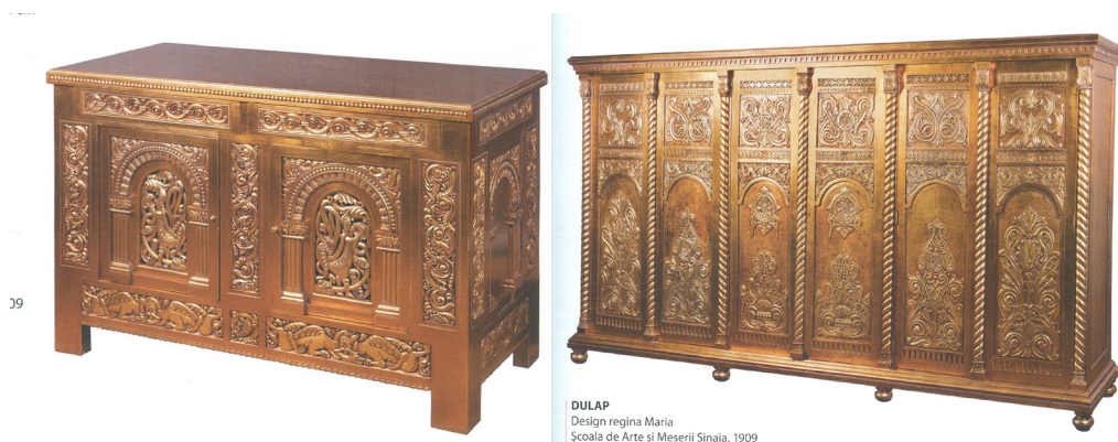
Fig. 3 Dulap și comodă desenate de regina Maria la 1909

- La 28 septembrie 1914, după moartea regelui Carol I, Ferdinand ține o cuvântare în Parlament, în care declară că va fi un bun român, iar în sală a fost un adevărat delir. S-a strigat: Trăiască regele, trăiască regina Maria, moment în care își dă voalul negru la o parte. La depunerea jurământului, glasul regelui se frânge în timp ce citea primul mesaj adresat Camerelor reunite, națiunii. Toți deputații erau în picioare și l-au auzit plângând în hohote 22 .