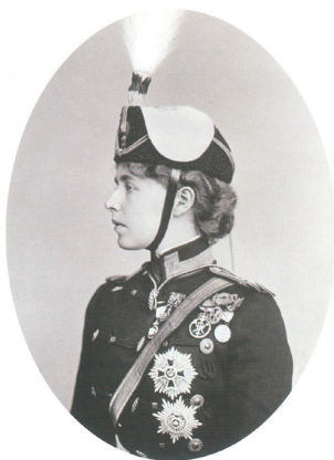
Principesa Maria în uniformă Regimentului 4 Roșiori Muzeul Național Peles