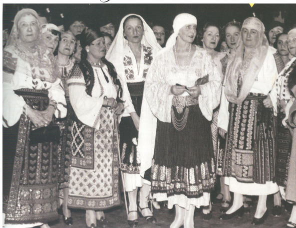
Fig. 5. Regina Maria în costum popular alături de membrele Ligii Femeilor