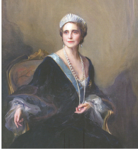
Fig. 8 Portretul reginei Maria făcut de pictorul Philip Lazlo

Nu trebuie să uităm prețul jertfelor, nu trebuie să uităm câte vieți s-au pierdut, nici grozăvia care a suspinat de la un capăt la altul al pământului 53 .