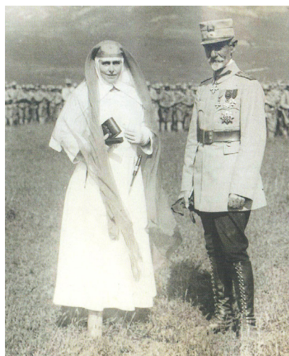
Fig. 2 Regina Maria cu generalul Averescu. 1917