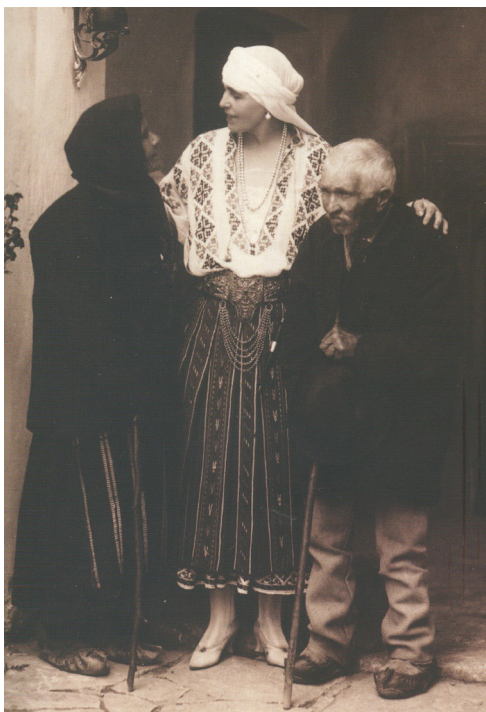
Fig. 10 Regina Maria alături de doi bătrâni la castelul Bran. 1922

Seara de 1 decembrie 1918 s-a încheiat la Cotroceni, printr-o cină în marea sală a palatului, la care au participat 120 de persoane” 55 .