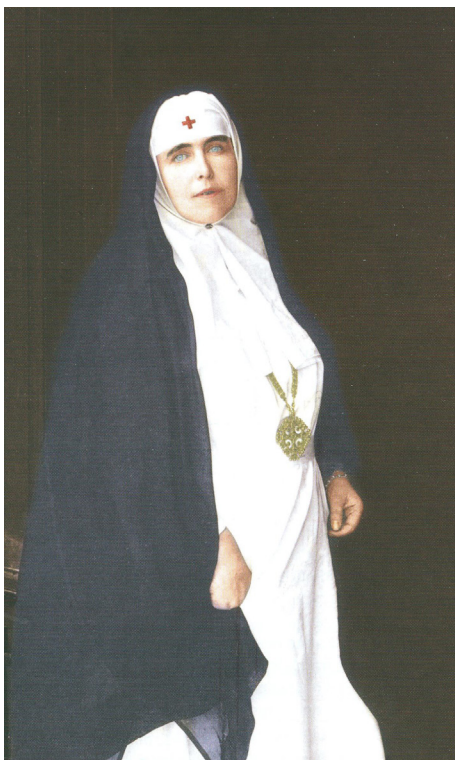
Fig. 7 Regina Maria în spitalul de campanie de la Ghidigeni – mai 1917