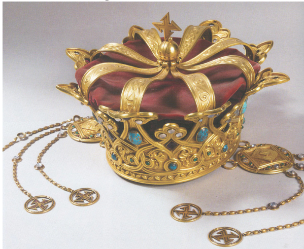
Fig. 6 Coroana reginei Maria. 1922