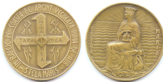
Fig. 9 Medalia „Regina Maria ” – Inima mea, țara mea România

Și-a îndeplinit datoria pe toate fronturile multiplei sale activități, dar înainte de toate pe acela al îmbărbătării și ridicării morale a celor ce trăiau în jurul ei. Regina Maria a întrupat frumosul, aspirațiunile cele mai înalte ale conștiinței românești”.