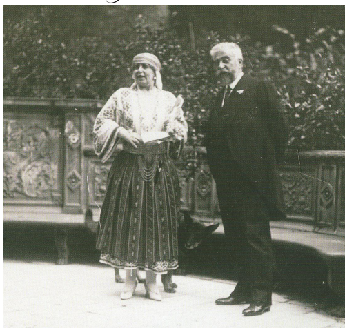
Fig. 6 Regina Maria și Ion I. C. Brătianu. 1923