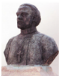
Bustul lui Alexee Mateevici, realizat în bronz, 1934.