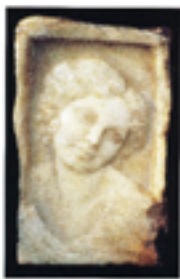
Autoportretul lui Al. Plămădeală cu soția Olga Plămădeală, realizat în bronz, 1934.

autoportretul cu soția – Olga Plămădeală, portretul pictorului I. Teodorescu-Sion, portretul poetului Ion Minulescu etc. Tot lui îi aparține și bustul funerar al poetului Alexei Mateevici de la Cimitirul Ortodox Central din Chișinău (1934).