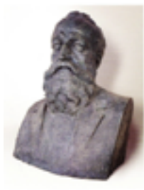
Bustul lui B. P. Hasdeu, realizat în bronz, 1934.

Al. Plămădeală a fost inițiatorul lansării în Chișinău al unui muzeu în aer liber, ansamblul sculptural Aleea clasicilor literaturii române , amplasat în grădina publică a capitalei. Mai mult, artistul avea elaborate câteva busturi care urmau să inaugureze viitoarea alee: cel al enciclopedistului B. P. Hasdeu, al poetului preot Alexee Mateevici, prietenul din tinerețe al lui Al. Plămădeală și bustul fabulistului Alexandru Donici. Capodopera lui Alexandru Plămădeală o constituie Monumentul lui Ștefan cel Mare din Grădina Publică cu același nume din Chișinău (1927).