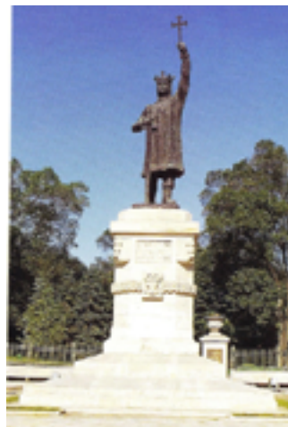
Monumentul lui Ștefan cel Mare, realizat în bronz, 1927.

S-a stins din viață la 15 iunie 1940, la vârsta de 51 de ani. La mormântul său din Cimitirul Ortodox Central de pe strada Armenească din Chișinău a fost instalat monumentul funerar cu un relief în bronz executat de fosta sa elevă Claudia Cobizeva. După evenimentele din 1940 colecția Pinacotecii din Chișinău a dispărut, o parte din lucrările sculptorului au fost distruse sau deteriorate și doar foarte puține lucrări au fost păstrate, grație eforturilor soției sale Olga Plămădeală. Astfel, Al. Plămădeală, recunoscut ca cel mai important plastician basarabean al secolului trecut, a ajuns să fie considerat și ca sculptorul cu cele mai multe lucrări dispăruțe.