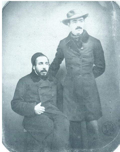
Fig. 1 Ion Ghica și Vasile Alecsandri la Constantinopol în 1850

Face studii la Paris, unde obține bacalaureatul în litere la Sorbona, în 1836. Urmează Școala de arte și manufacturi (1836-1837) și în anul 1838 devine absolvent al Facultății de Științe din Paris, cu o diplomă în științe matematice. Este și absolvent al Școlii de Mine, unde obține diploma de inginer de