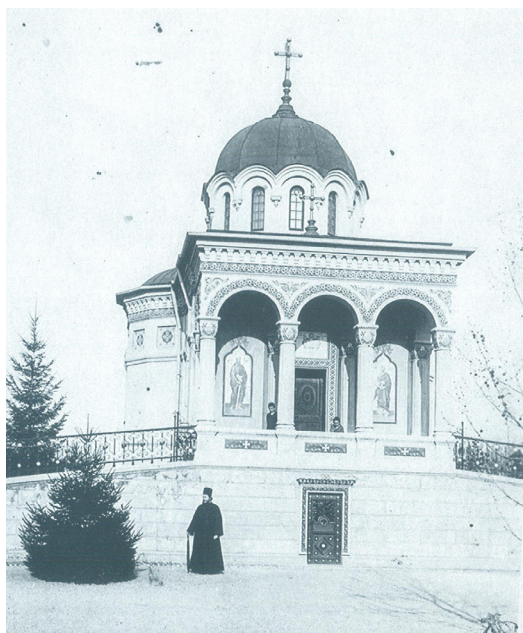
Fig. 3. Capela Ghica de la Ghergani- anul 1900

La Ghergani, până la 1875, au existat două conace. Vechiul conac ridicat pe fundațiile unui edificiu mai vechi și altul construit de Tache Ghica, tatăl lui Ion Ghica, între 1826 și 1831, care constituie aripa de răsărit a vechiului conac, ambele