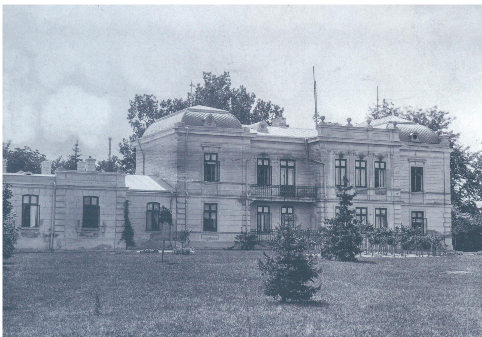
Fig. 2. Conacul lui Ion Ghica de la Ghergani

La termiarea misiunii sale, în 1859, a primit de la sultanul Abdul Medjid titlul onorific de Bei (prinț) de Samos .