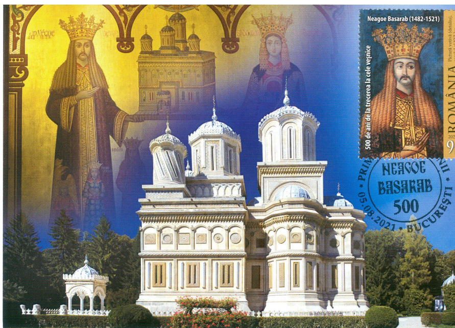
Fig. 5 Carte poștală cu timbrul Neogoe Basarab

Cu prilejul restaurării din secolul al XIX-lea, pictura a fost desprinsă de pe peretele bisericii și, după un periplu de mai multe decenii prin diferite muzee, a ajuns la Muzeul Național de Istorie a României, unde a fost supusă, în perioada anilor 2008-2009, unui meticolos proces de restaurare.