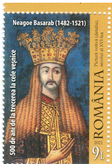
Fig. 1 Timbrul cu valoarea nominală de 9 lei

În timpul domniei sale a fost construită Mănăstirea Curtea de Argeș, în jurul căreia s-a născut legenda Meșterului Manole.