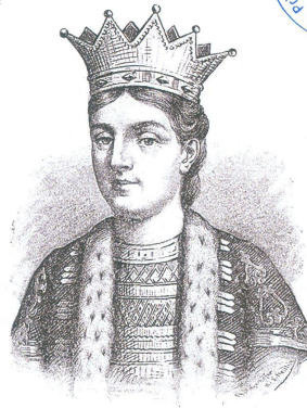
Doamna Stanca, soția lui Mihai Viteazul