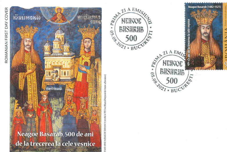
Fig. 4 Plicul „prima zi” cu ștampila din 5 august 2021

A fost canonizat de Sfântul Sinod al Bisericii Ortodoxe Române în data de 8 iulie 2008, care a hotărât proslăvirea Sfântului Voievod Neogoe Basarab , pentru faptele sale sfinte și înflorirea vieții spirituale duhovnicești ortodoxe din Țara Românească. Prăznuirea lui se face pe data de 26 septembrie.