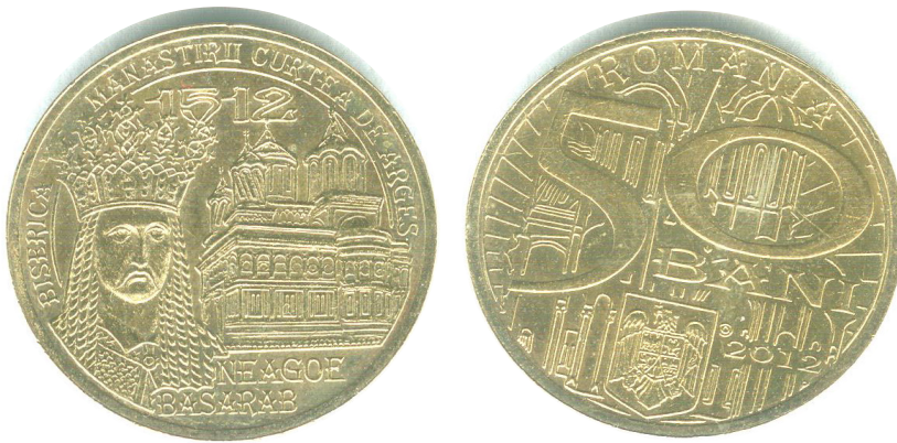
Fig. 3 Moneda de 50 de bani cu Neogoe Basarab

La 500 de ani de la urcarea lui Neogoe Basarab pe scaunul Țării Românești, Banca Națională a României a pus în circulație, la 25 iunie 2012, o emisiune monetară formată dintr-o monedă de aur cu titlul de 900 ‰, având valoarea nominală de 100 de lei, într-un tiraj de 250 de exemplare și dintr-o monedă comemorativă de circulație, de alamă, cu valoarea nominală de 50 de bani, emisă într-un tiraj de 1.000.000 de exemplare 3 .