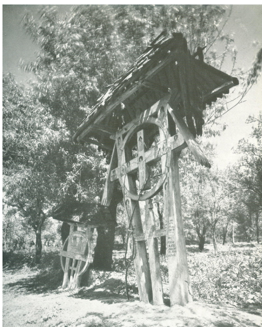
Fig. 3 Troiță din Muscel

Urmează un alt articol intitulat CELE MAI FRUMOASE DRUMURI DIN ȚARĂ , care este redactat de Emanoil