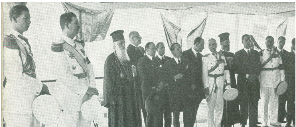
Fig. 5. Ziua Marinei – 8 septembrie 1938

După patru ani de amânări, nava a fost adusă la Galați ca să fie reparată, dar în data de 9 septembrie 1979, s-a răsturnat în Dunăre, din cauza scăderii nivelului apei și a unei administrări deficitare. În anul 1983, s-a inițiat tăierea navei, care s-a finalizat în anul 2008.