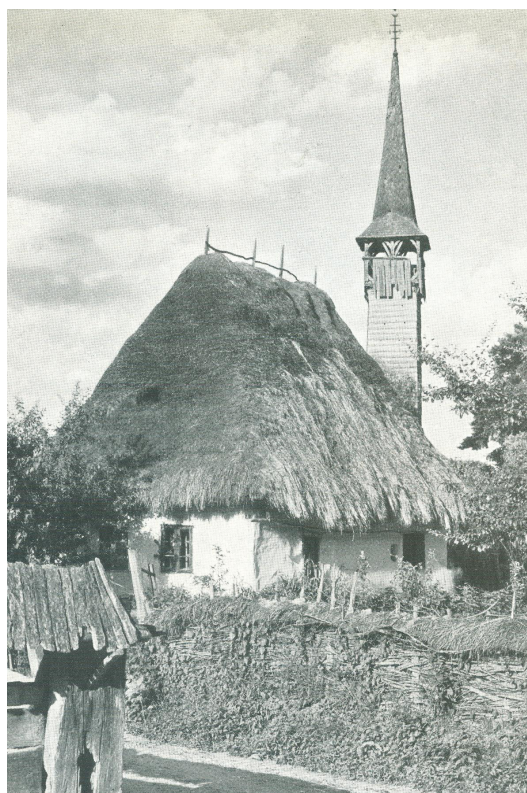
Fig. 4. Biserica din Săcălășeni