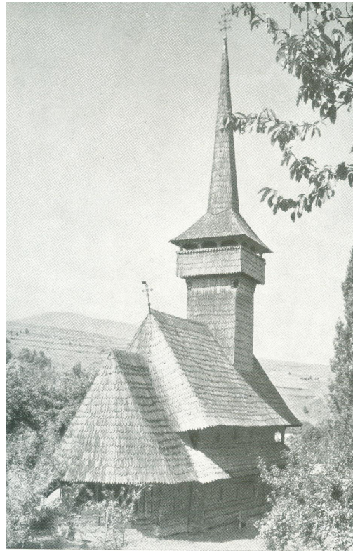
Fig. 6. Biserica de lemn din Borșa

În finalul revistei, sunt prezentate marcajele cu triunghiul roșu, linie orizontală albastră și linie verticală albastră pe lanțul Munților Ezer-Păpușa Muscel. Nu sunt omise Taberele Străjerești de la munte și mare.