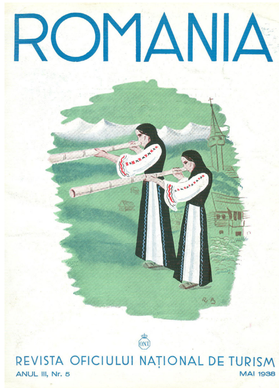
Fig. 1. Coperta Revistei O.N.T. mai 1938

Pădurea, codrul, râurile, sunt pline de amintiri mitologice și aceste umbre ale mitologiei noastre, mai întovărășesc și azi multe suflete ale satelor. Basmul și legenda sunt strâns legate de obrazul peisajului românesc.