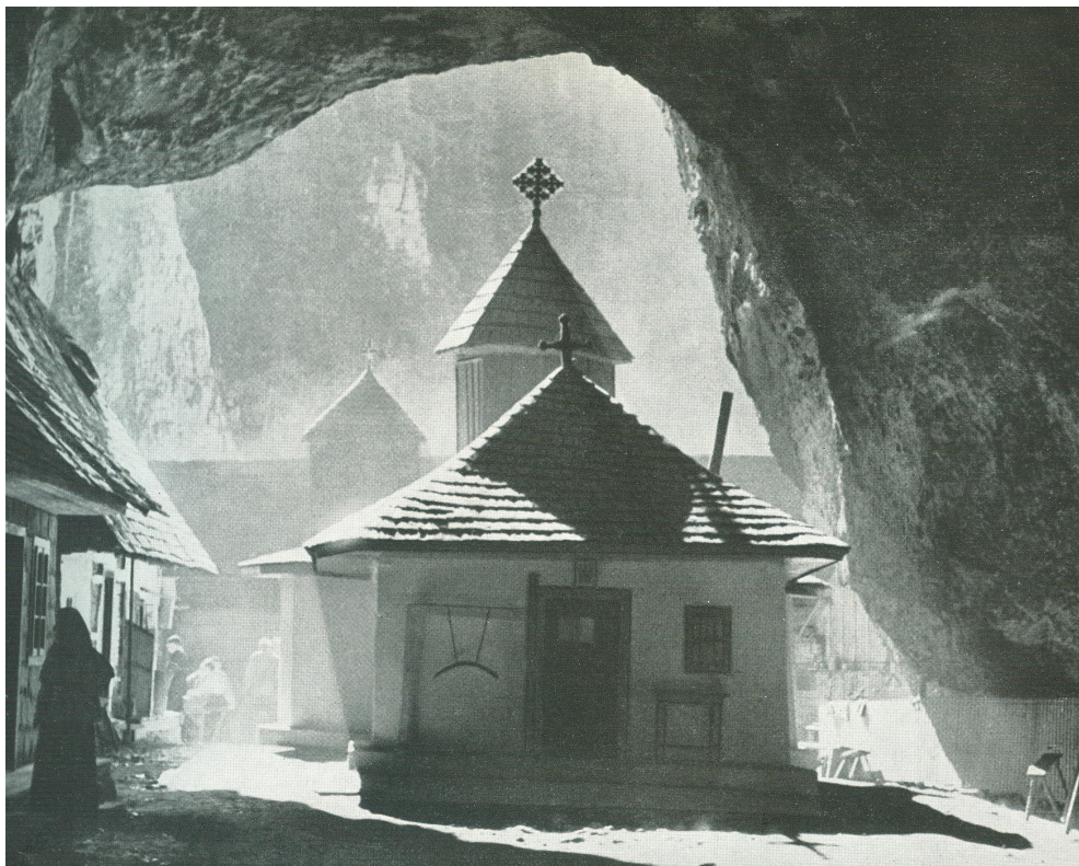
Fig. 4. Schitul din peștera Ialomicioarei