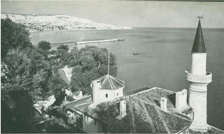
Fig. 3. Balcic

Dar mai rămâne să trecem prin fața ochilor amintirii celor ce le cunosc și să trezim curiozitatea pornită din inimă acelor ce nu cunosc, priveliștele din Moldova și Bucovina, care, sub spinări de munți și dealuri sbârlite de păduri sau în poalele verzi ale văilor, țin giuvaieruri moștenite peste secole de la voievozi, mănăstirile cu hram și zugrăveală vestită.