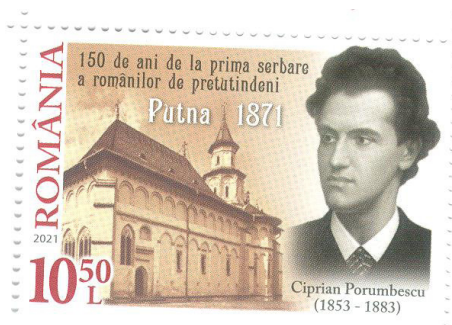
Fig. 3 Portretul lui Ciprian Porumbescu pe timbrul cu valoarea de 10,50 lei

Serbarea a fost deschisă seara cu 21 salve de tun trase de pe dealurile din împrejurime, urmată de slujba religioasă. În dimineața următoare A. D. Xenopol ține o prelegere despre Ștefan cel Mare, ca exponent național.