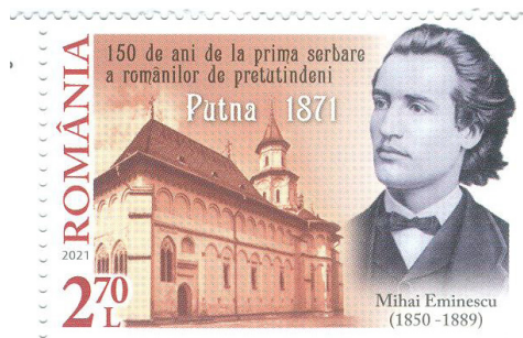
Fig. 1 Portretul lui M. Eminescu pe timbrul cu valoarea de 2,70 lei

La Putna urma să fie primul congres al studenților români de pretutindeni și reprezenta un liant între două generații: generația de la 1848, marcată de afirmarea identității naționale și generația de sacrificiu a Primului Război Mondial.