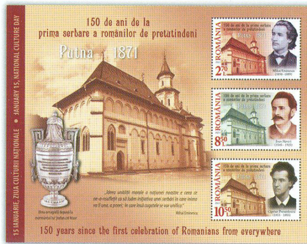
Fig. 4 Blocul cu cele trei timbre dantelate și urna omagială

Romfiatelia a onorat acest eveniment cu o emisiune de mărci poștale unde sunt reproduse într-o asociere grafică sugestivă, alături de biserica Putna unde este înmormântat Ștefan cel Mare, trei portrete reprezentative.