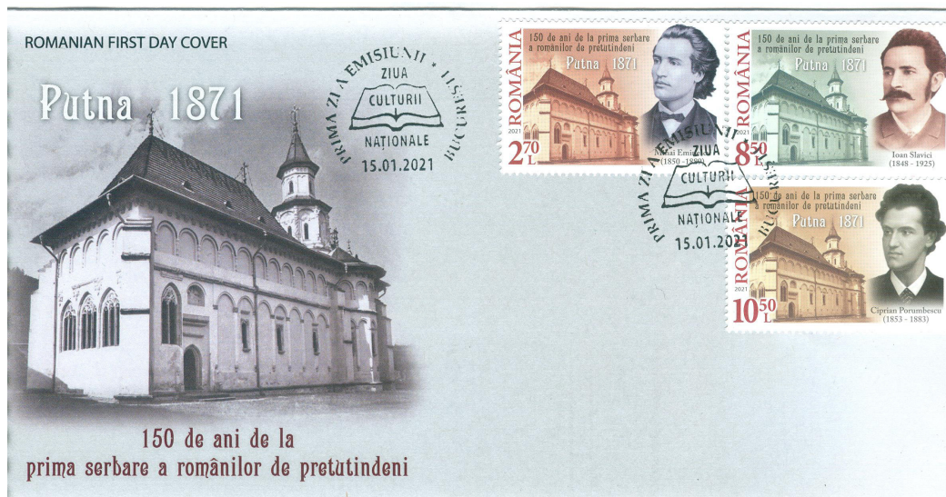
Fig. 5 Plicul „prima zi” echipat cu timbrele emisiunii

Romfilatelia a emis și un bloc cu cele trei timbre dantelate alături de imaginea bisericii Mănăstirii Putna și fotografia urnei omagiale, aflate în prezent în Muzeul Mănăstirii Putna.