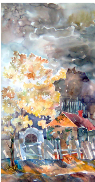
Nostalgie pentru casa bunilor

Cu cîtă creativitate este lucrată fiecare piesă, aplicînd diferite pînze. Privind atent fiecare lucrare – citești un mesaj ne spus dar înțeles. Citiți