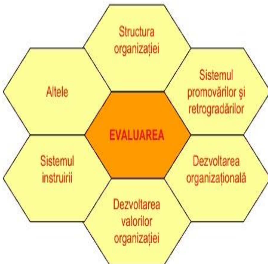
Figura 10. Sistemul de evaluare al organizației (după N. Pânișoară, 2005, 147)